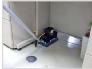
▲ 入り組んだ狭い箇所