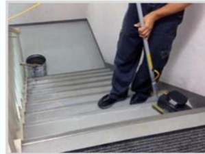
▲ 階段洗浄も安全スピーディー