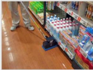
▲ 什器際などの隅こすり